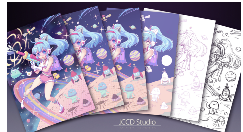
<レッスン6段階イメージ>

e-Learning URL : http://hahow.in/cr/inouetakakospacegirl