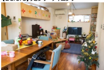
【Before】リビング・ダイニング