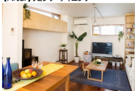
【After】リビング・ダイニング