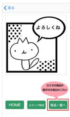
6 完成イメージを確認