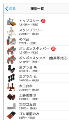
7 豊富なスタンプからお好きなものを選んで注文