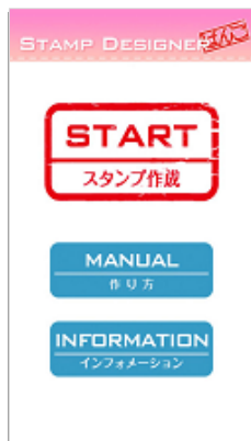
1「スタンプ作成」を選択