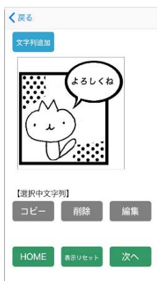
5 文字を追加し、好きな位置にデザイン