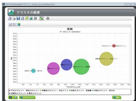
▲クラスタリングモデルの作成例

今後も、KXEN InfiniteInsight®は、データ分析に対するニーズにお応えするため、定期的なバージョンアップを予定しております。