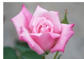
レディラック(ナリスローズガーデン)

当社の美容理論「W(洗う)・C(角質ケア)・C(化粧水)・C(クリーム)・F(ファンデーション)」が示す通り、当社はベースメイクまでがスキンケア、ベースメイクは肌を守るために必要なスキンケアだと考えています。その考え方は1981年に発売した「ドレッシーク」ブランド以降ずっと「スタイリーク」にも受け継がれ、肌を美しく見せるだけでなく、肌そのものを美しくしていきたいと考えています。アルテロモナス発酵エキス(保湿剤)や天然ビタミンE※4に加えて、加水分解コメヌカエキス・ハイブリッドローズ花エキス・パウダールコ樹皮エキス※3といったボタニカル由来の保湿剤を配合、使うほどに肌の潤いを守ります。※3 トコフェロール/保湿剤 ※4 タバプイアインベチギノサ樹皮エキス/保湿剤