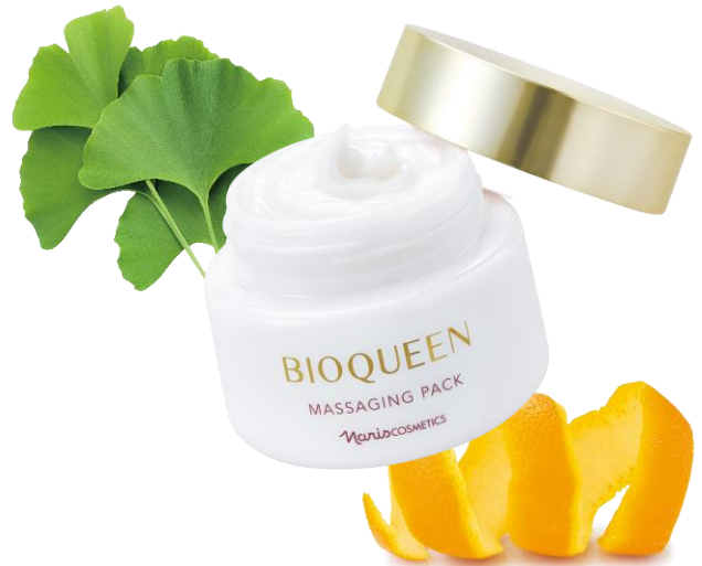
ビオクィーン マッサージング パック

株式会社ナリス化粧品(本社：大阪市福島区 代表取締役社長：村岡弘義)は、現在当社が発売するスキンケアブランドの中で最も長い期間販売しているブランド「ビオクィーン」から、追加アイテムの「マッサージングパック」を発売。2023年12月21日からリニューアル発売している既存品の4品は、リニューアル前後で前年比数量が4倍以上※1と大きく伸長。ユーザーに待ち望まれていた製品だということに改めて実感、(※1 2022年10月21日～2023年10月20日と、2023年10月21日～2024年10月20日の比較で、434%) 新製品の追加投入でさらにユーザー満足度を高めます。「ビオクィーン マッサージング パック」は一年で最も寒く肌のこわばりや乾燥が気になる2025年1月21日から訪問販売及び全国のナリス化粧品店舗と通販(ナリスオンラインストア)で新発売します。