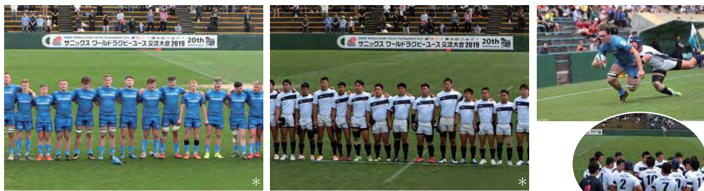
試合前のセレモニーでは、両国国歌を吹奏します。エクセター カレッジ (イングランド) 対大阪桐蔭高等学校。