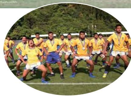
表彰式後のニュージーランドチームのハカ。

海外チームとの試合で一番感じたことは、海外チームの体の大きさです。国内では、なかなか経験できない相手で、良い経験ができました。 (男子国内チームキャプテン談)