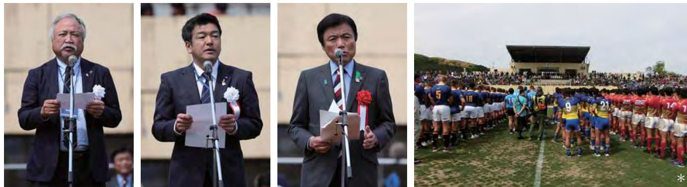
(公財) 日本ラグビーフットボール協会 森重隆副会長 (当時)