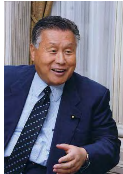
公益財団法人日本ラグビーフットボール協会 元名誉会長 森 喜朗 様