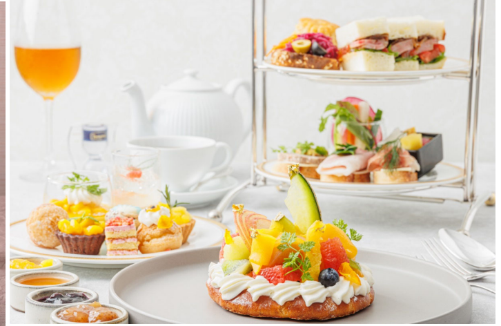
プレミアムアフタヌーンティセット