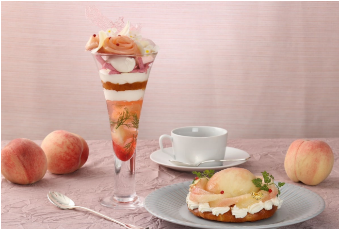
特製桃パフェ+デザートピザセット