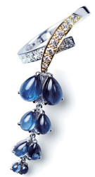
2017年 ゴールデングローブ賞