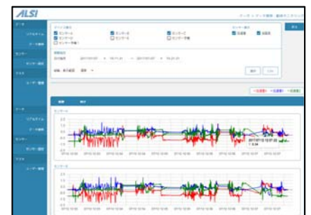
▲管理画面のイメージ