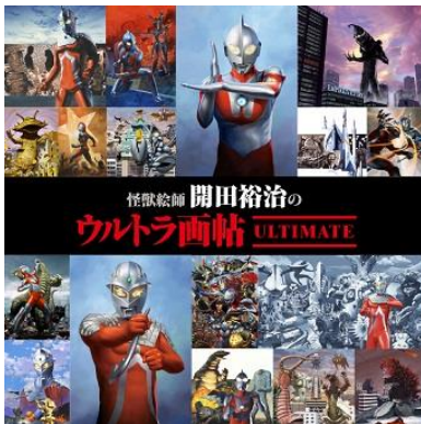
「怪獣絵師 開田裕治のウルトラ画帖 Ultimate」