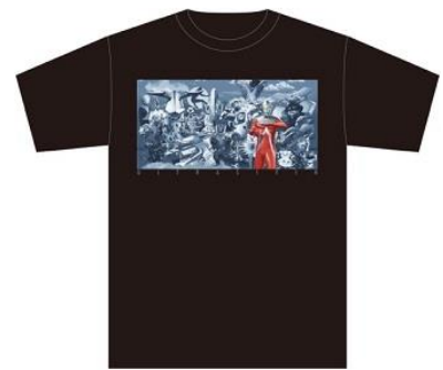
ウルトラセブン エメリウムTシャツ