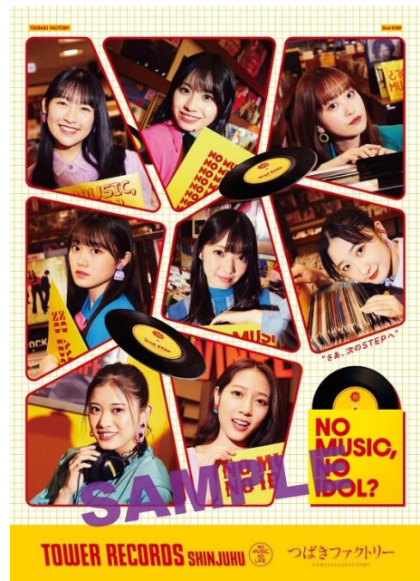
「NO MUSIC, NO IDOL?」 コラボポスター&ポストカード絵柄

※緊急事態宣言に応じ休業している一部店舗でのご予約は営業再開後からの受付となります。店舗情報をご確認ください。