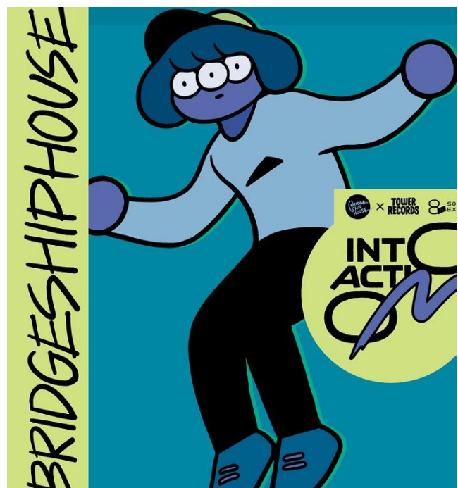
BRIDGE SHIP HOUSE 8th Solo Exhibition “INTO ACTION” メインビジュアル

BRIDGE SHIP HOUSE の「ハチカイ」目のソロ展示会を渋谷店の「ハチカイ」で、ぜひ体感してください！