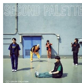
COLOR CREATION「SECOND PALETTE」左より初回限定盤、通常盤 A、通常盤 B