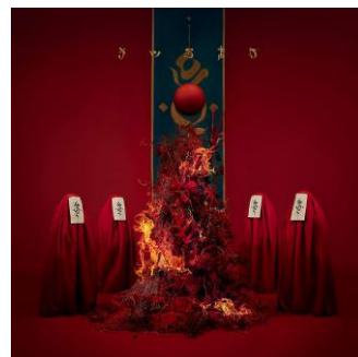
キタニタツヤ『DEMAGOG』初回限定盤(左) 通常盤(右)