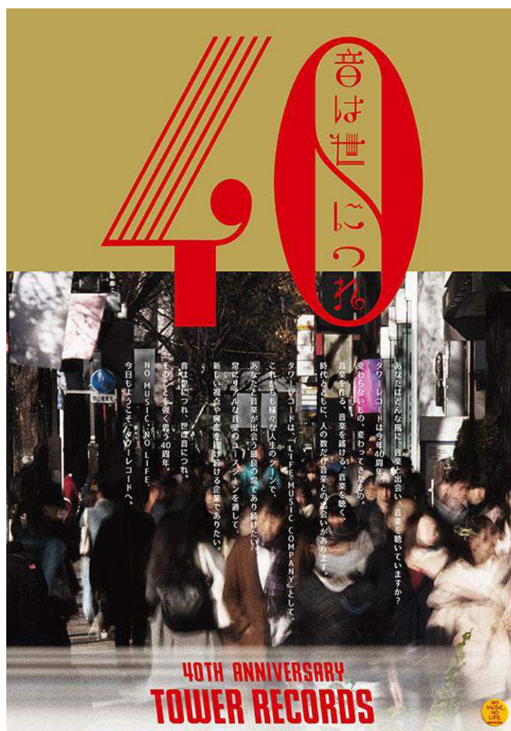
タワーレコード40周年記念施策 ポスター

年末の映画公開に向け、タワーレコードではコーポレート・ボイスである「NO MUSIC, NO LIFE.」を和モノに落とし込んだマーチャンダイジング・シリーズ「タワレコじゃぱん」のグッズ制作などで「男はつらいよ」とのコラボレーションを予定しています。