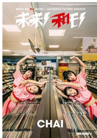
第6弾 CHAI (2019年2月12日発行)