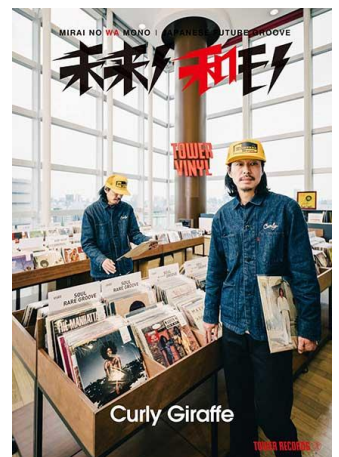
第8弾 Curly Giraffe (2019年4月23日発行)