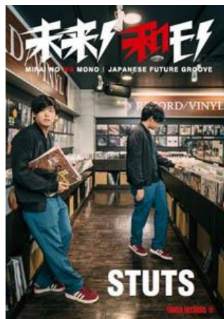
第2弾 STUTS (2018年9月4日発行)