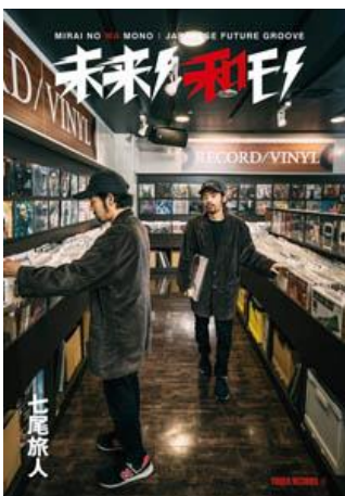
第5弾 七尾旅人 (2018年12月11日発行)