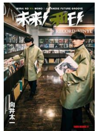
第4弾 向井太一 (2018年11月27日発行)