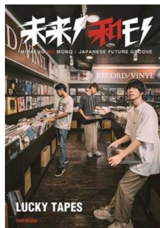
第3弾 LUCKY TAPES (2018年10月2日発行)