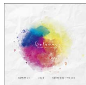
「TOWER RECORDS presents COLOURS - VICTOR JAZZ NATION」