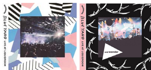
「BLUE YARD LIVE AT LIQUID ROOM [CD+DVD]」 Aバージョン、Bバージョン

【商品情報】 http://tower.jp/article/feature_item/2018/03/10/0101