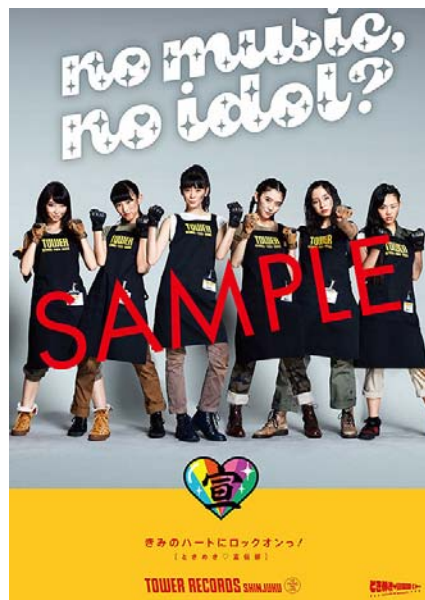
「NO MUSIC, NO IDOL?」 ときめき♡宣伝部 コラボレーションポスター

今回のコラボレーションでは、「NO MUSIC, NO IDOL?」“ときめき♡宣伝部”コラボレーションポスター（B2サイズ）を制作。ご予約者優先で対象店舗（タワーレコード15店舗）にてニューシングル『DEADHEAT』期間限定生産びっぐ盤をご購入いただいた方に、先着で「NO MUSIC, NO IDOL?」“ときめき♡宣伝部”コラボレーションポスターを差し上げます。