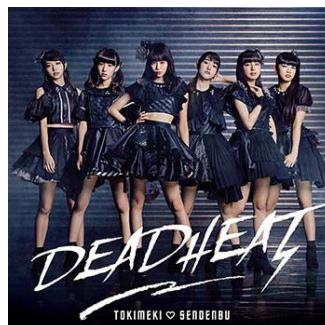
『DEADHEAT』期間限定生産びっぐ盤

【対象店舗】タワーレコード15店舗[札幌ピヴォ店/仙台パルコ店/郡山店/新宿店/横浜ビブレ店/高崎オーパ店/新潟店/静岡店/名古屋パルコ店/梅田 NU 茶屋町店/神戸店/広島店/高松丸亀町店/福岡パルコ店/那覇リウボウ店]