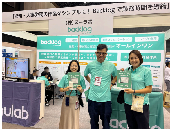
過去に出展した他展示会のブースの様子

バックオフィス業務のDXを推進したい方は、ぜひお気軽にヌーラボのブース(小間番号 4-24)へお立ち寄りください。