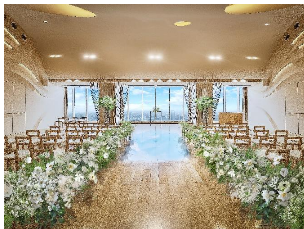
▲地上200メートル天空のチャペル「スカイホールそら」

エスクリは、ブランドメッセージ「All for Thank you（オールフォーサンキュー）」※2のもと顧客満足度向上を目指し、衣裳、料理、写真など、婚礼に関する各アイテムを内製化することによってワンストップサービスを提供しております。『GRADATIONS（グラデーションズ）』でも、ブランドメッセージ「All for Thank you」のもと、新郎新婦とゲストの皆様にご満足いただけるサービスを提供してまいります。