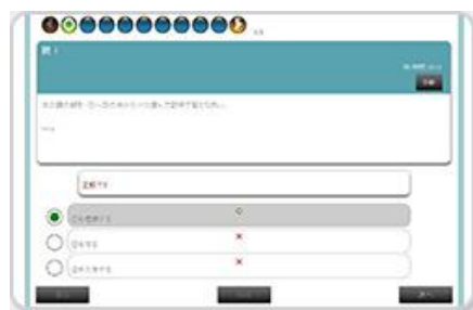
▲受講確認テスト画面