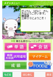
メインメニュー選択画面