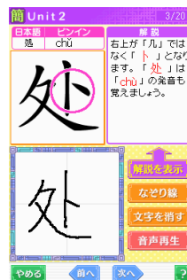
簡体字練習帳画面