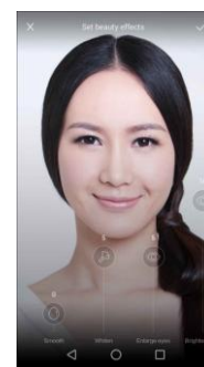
5項目・10段階のカスタム補正設定