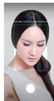
3アングルからユーザーの顔を登録

正面顔／横顔／俯き顔の3アングルを事前に登録することで、友達や家族などと一緒に撮影しても、ユーザーを認識し、自動で設定された補正を行います。