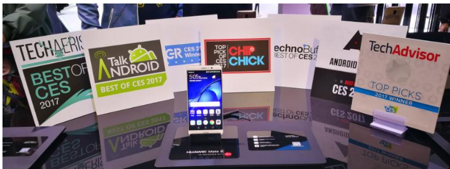
HUAWEI Mate 9 が CES 2017 で受賞した賞の数々

CES での受賞に加え、Android Authority は、素晴らしいデバイス、ビジネスの洞察力、そして 2016 年の卓越した成功への技術的統率力を評価し、HUAWEI を「Manufacturer of the Year」に選びました。