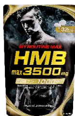
マイルーティーン MAX HMBmax3500