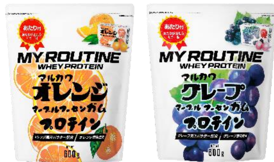
マイルーティーン マルカワ フーセンガム風味プロテイン (左：オレンジ、右：グレープ)