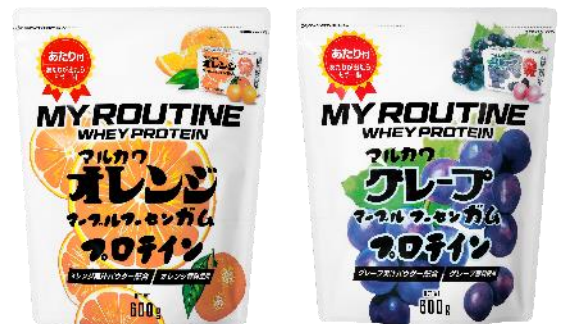
マイルーティーン マルカワ フーセンガム風味プロテイン (左：オレンジ、右：グレープ)