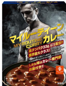
マイルーティーン カレー 中辛 180g