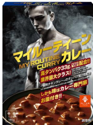
マイルーティーン カレー 中辛 180g

※1 日本国内で流通するレトルトカレー製品の範囲内(2021年11月時点) ※2 中辛/栄養成分表示 ※3 自社シリーズ内