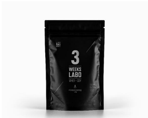
3 Weeks Labo Power Coffee 600g