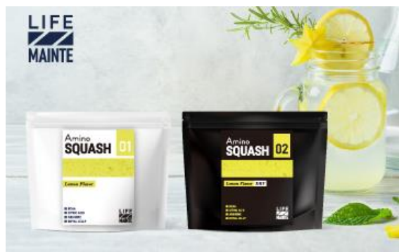
アミノスカッシュ レモンフレーバー/ドライ

商品名：Amino SQUASH（アミノスカッシュ） Lemon Flavor / DRY 内容量：100g 価格：2,700円（税込） 発売日：2021年6月28日(月)