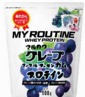
マイルーティーン マルカワ マーセンガム風味プロテイン