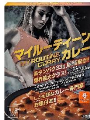
マイルーティーン カレー 甘口