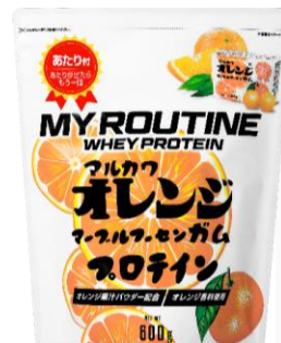
マイルーティーン マルカワ マーセンガム風味プロテイン