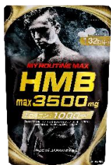
マイルーティーン MAX HMBmax3500