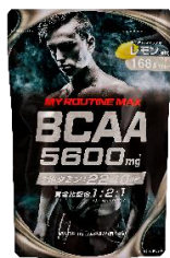
マイルーティーン MAX BCAA5600