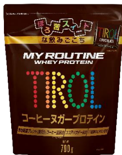
マイルーティーン チロルチョコ コーヒーヌガー風味プロテイン