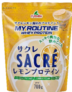
マイルーティーン サクレレモン風味プロテイン