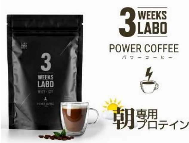
3 Weeks Labo 600g