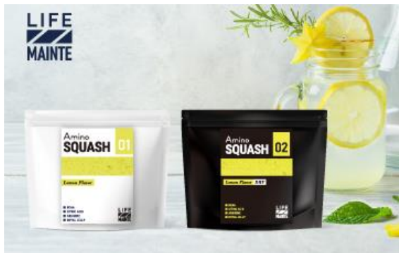
アミノスカッシュ レモンフレーバー/ドライ