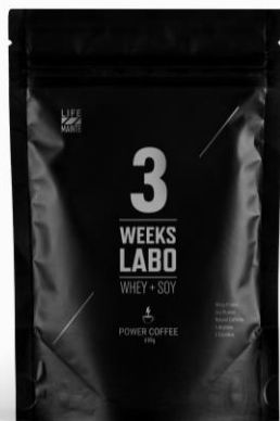
3 Weeks Labo 600g

シェイカーに、付属のスプーンで大盛り2杯と200mLの水や牛乳を入れ、よく振って混ぜてお召し上がりください。