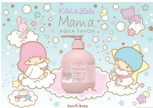
© 2021 SANRIO CO., LTD. APPROVAL NO. L624509

キキ&ララがシャボン玉で遊ぶ姿がかわいらしい限定デザインは、2020年の発売時に好評を博し完売。累計販売本数16万本突破 (※1) と多くの方にご使用いただいている「モイストマルチクリーム」による保湿ケア時間が、もっと楽しいスキンケア時間になることを願い、再発売することとなりました。