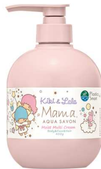
© 2021 SANRIO CO., LTD. APPROVAL NO. L624509