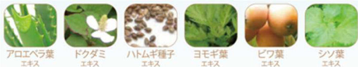
アロエベラ葉 エキス ドクダミ エキス ハトムギ種子 エキス ヨモギ葉 エキス ビワ葉 エキス シソ葉 エキス