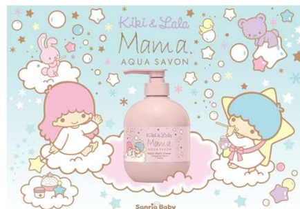
© 2021 SANRIO CO., LTD. APPROVAL NO. L624509