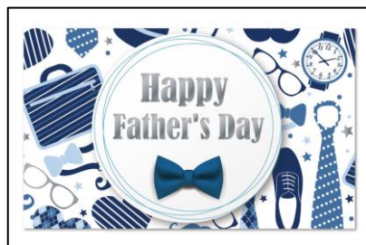
父の日メッセージカード（表）

裏面は心温まる“お父さん、いつもありがとう！”の手書き風メッセージ入り。余白は白地なので、お名前や追加のメッセージの書き足しもして頂けます。