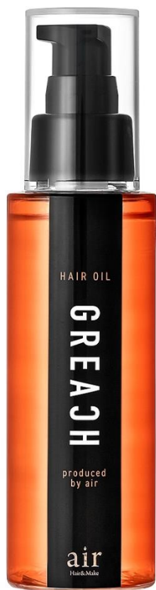
グリーチ ヘアオイルセラム 100ml

※6 保湿成分：ヒマワリ種子油、オリーブ果実油、ホホバ種子油、アーモンド油、サフラワー油、ブドウ種子油、アルガンアスピノサ核油、アンス核油、マカデミア種子油、カニナバラ果実油