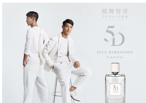
ファイブディメンション サード 商品ビジュアル