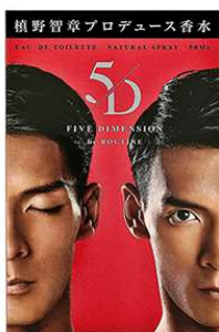
ファイブディメンション オードトワレ 50mL