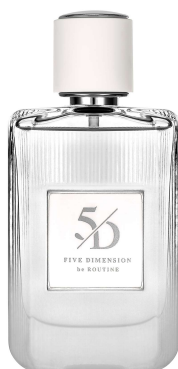
ファイブディメンション オードトワレ サード 50mL