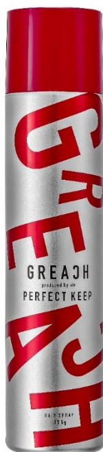
グリーチ パーフェクトキープ ヘアスプレー

株式会社ウエニ貿易（本社：東京都台東区 代表取締役：宮上光弘）は、オリジナルメンズヘアスタイリングブランド『GREACH』（グリーチ）から、ワックスとジェルの特長を併せ持つヘアジェルワックスとセットカが変幻自在のヘアスプレーを、ウエニ貿易公式オンラインショップでの販売に先駆けて、11/28(土)よりロフトネットストア(カートオープン時間10:00)、全国のロフト各店（一部店舗を除く）にて、販売を開始します。