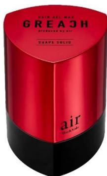
グリーチ シェイプソリッド ヘアジェルワックス

「GREACH」は、 10代後半～30代前半の男性をターゲット にしたヘアスタイリングブランドです。