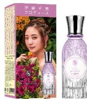
ティントメロディ イン シークレット オードトワレ 45mL