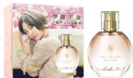
ティントメロディ インフルール オードトワレ 30mL