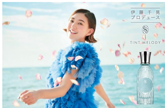
ティントメロディ ブリリアント リゾート オードトワレ メインビジュアル

フレグランス、時計、ファッション雑貨等のブランドを取り扱う専門商社である株式会社ウエニ貿易（本社：東京都台東区 代表取締役社長：宮上光弘）は、アーティスト・モデルとして活躍中の伊藤千晃がプロデュースするフレグランスブランド「ティントメロディ (TINT MELODY)」から、12/4(金)に第4弾となる『ティントメロディ ブリリアント リゾート オードトワレ』の販売を開始します。