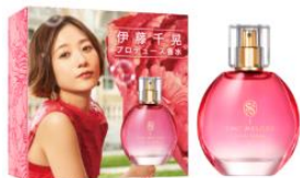
ティントメロディ ハッピーハーモニー オードトワレ 30mL