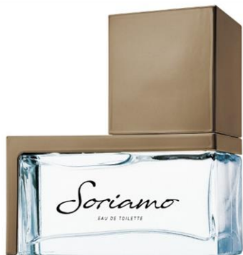
ソリアーモ ダークゴールド オードトワレ 50mL