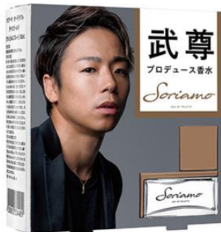
スリーブ (外箱カバー)