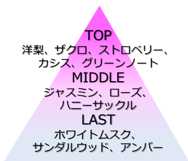
香りのイメージ図