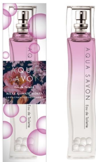
アクア シャボン 心やすらぐアロマティックフローラルの香り オードトワレ (左) 外箱、(右) ボトル (ガラス玉入り)

フレグランス、時計、ファッション雑貨等のブランドを取り扱う専門商社である株式会社ウエニ貿易（本社：東京都台東区、代表取締役社長:宮上光弘）は、せっけんの香りをテーマにしたコスメティックブランド「アクア シャボン ( https://aquasavon.jp/ )」からドン・キホーテ限定のオードトワレを新発売します。