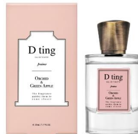
ディーティン フレイン オードトワレ 50mL