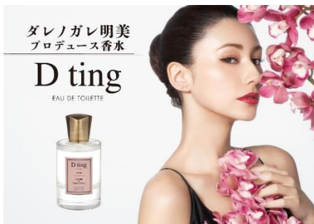
ディーティン フレイン メインビジュアル