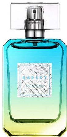
ラッドスカイ フリースタイル オードトワレ