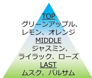
香りのイメージ図

スポーティで爽やかなフルーツミックスのトップノートから、男性のセクシーさを際立たせる花々のミドルノート、落ち着きを感じるウッド系のラストノートと、スポーツシーンにぴったりの爽やかな香りです。