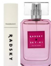
④ラッドスカイ ネオン オードトワレ

女子ウケ◎ 清潔感のある石けんの香り が異性との距離を縮める スマートサボンの香り。