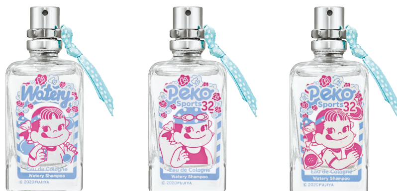
アクアシャボン × ペコちゃん運動会 コロン ウォーターリーシャンプーの香り ・運動会オリジナル ・水泳 ・パン食い競走

2019年4月に発売して大好評、完売したペコちゃんコラボ香水の第二弾が登場！今回は 33種類 の“運動会”モチーフデザイン。かわいいボトルがアクティブな気持ちも盛り上げます。