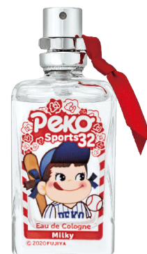
アクアシャボン × ペコちゃん運動会 コロン ミルキーの香り オリジナル