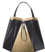
※折り紙がイメージ