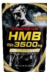
マイルーティーン MAX HMB3500