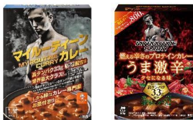
(左)マイルーティーン カレー 中辛 (右)マイルーティーン カレー うま激辛