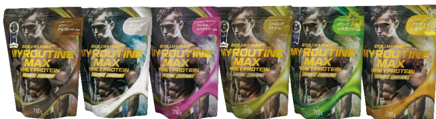
(左から) パワーチョコレート風味 / スティックバニラ風味 / マッスルストロベリー風味 / ストロングバナナ風味 パンプマスカルット風味/アクセルレモネード風味

「MY ROUTINE MAX (マイルーティーン マックス) 700g」は、1食あたりタンパク質量25g以上、 最大26.8g 摂取できる配合量 を実現しています。(フレーバーにより異なります。) なりたいカラダを共に目指し自分を高めて、打ち勝つ*強さと身体づくりをサポートします。 ホエイプロテイン (WPC)100%使用し、吸収スピードが早く、さらにHMB成分を1食あたり35mg配合。プロテインの効果をより高めます。