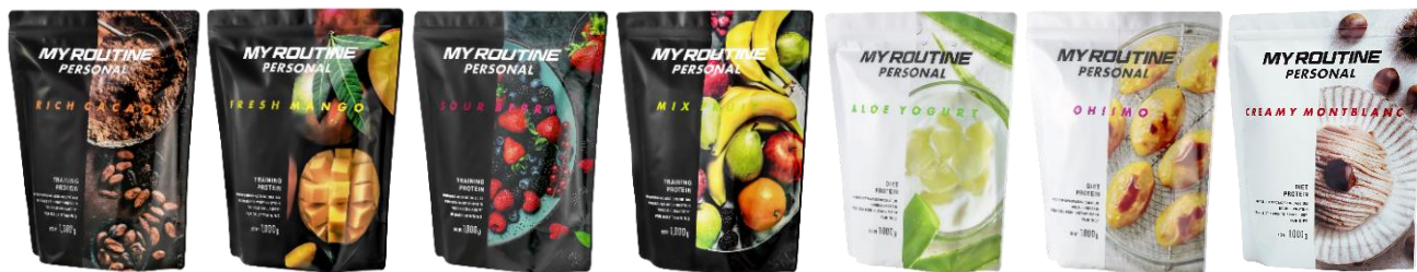
（左から）リッチカカオ風味・フレッシュマンゴー風味・サワーベリー風味・ミックスフルーツ風味・アロエヨーグルト風味・オイモ風味・クリーミーモンブラン風味

どちらも牧草飼育（グラスフェッド）のみで育てた乳牛由来のホエイプロテインを配合し、「TRAINING PROTEIN」は、WPIブレンドで、トレーニング後のタンパク質摂取スピードを高め、さらにマッスルコラーゲンと不足しやすい乳酸菌22種も配合（殺菌末）。「DIET PROTEIN」は、カゼインブレンドで、腹持ちよく持続的にタンパク質を身体に取り込みやすい成分設計にし、食物繊維（難消化性デキストリン）と不足しがちな乳酸菌22種も配合（殺菌末）しています。