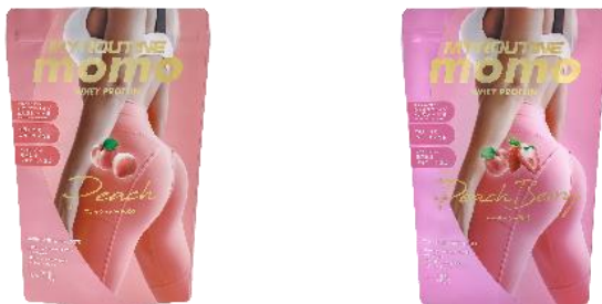
（左から）マイルーティーン MOMOフレッシュピーチ風味・マイルーティーン MOMOピーチベリー風味

「もっとキレイに、もぎたてボディへ。」キュッと丸く、美しいラインをめざし、美しく健康でいたい、女性向けのシリーズです。吸収スピードの違う2種のプロテイン（ホエイ・ソイ）を配合し、持続的にタンパク質を身体に取り込みやすい設計に。また、美容に嬉しいコラーゲン&食物繊維（難消化性デキストリン）を配合し、女性らしい美ボディをサポートします。