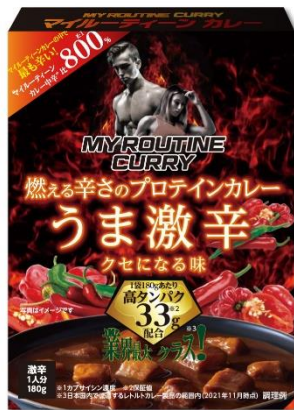
マイルーティーン カレー うま激辛 180g