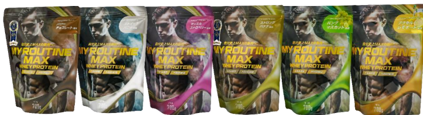
(左から) パワーチョコレート風味 / スティックバニラ風味 / マッスルストロベリー風味 / ストロングバナナ風味 パンプマスカット風味/アクセラレモネード風味

「MY ROUTINE MAX (マイルーティーン マックス) 700g」は、1食あたりタンパク質量25g以上、 最大26.8g 摂取できる 配合量を実現しています。(フレーバーにより異なります。)