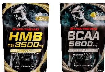
(左)マイルーティーン MAX HMBmax3500 (右)マイルーティーン MAX BCAA5600