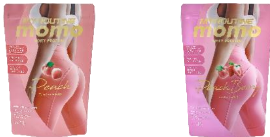
（左から）マイルーティーン MOMOフレッシュピーチ風味・マイルーティーン MOMOピーチベリー風味

「もっとキレイに、もぎたてボディへ。」キュッと丸く、美しいラインをめざし、美しく健康でいたい、女性向けのシリーズです。吸収スピードの違う2種のプロテイン（ホエイ・ソイ）を配合し、持続的にタンパク質を身体に取り込みやすい設計に。また、美容に嬉しいコラーゲン&食物繊維（難消化性デキストリン）を配合し、女性らしい美ボディをサポートします。