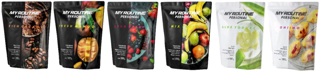
（左から）リッチカカオ風味・フレッシュマンゴー風味・サワーベリー風味・ミックスフルーツ風味・アロエヨーグルト風味・オイモ風味

どちらも牧草飼育（グラスフェッド）のみで育てた乳牛由来のホエイプロテインを配合し、「TRAINING PROTEIN」は、WPIブレンドで、トレーニング後のタンパク質摂取スピードを高め、さらにマッスルコラーゲンと不足しやすい乳酸菌22種も配合（殺菌末）。「DIET PROTEIN」は、カゼインブレンドで、腹持ちよく持続的にタンパク質を身体に取り込みやすい成分設計にし、食物繊維（難消化性デキストリン）と不足しがちな乳酸菌22種も配合（殺菌末）しています。