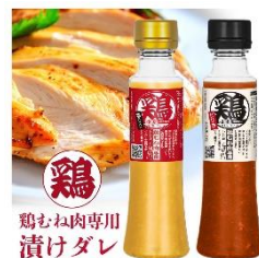
(左から)マイルーティーン 鶏もね肉はごはんつぶ塩こうじ味/ピリ辛こうじ味