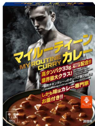
マイルーティーン カレー 中辛 180g