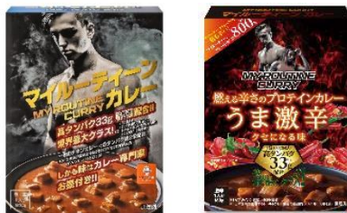
(左)マイルーティーン カレー 中辛 (右)マイルーティーン カレー うま激辛