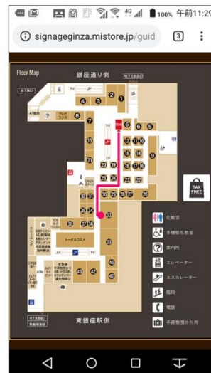
▲スマートフォン道案内