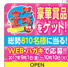
地域産品応援シール