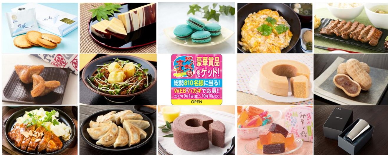
対象商品一例(表示順)

今回から、Web(パソコン・スマホ)もしくはハガキのどちらからでも応募できるようになり、より気軽に企画に参加いただけます。